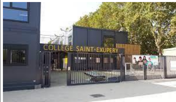
Aménagements du site Saint-Exupéry à Vincennes, financés à hauteur de 5 millions d'euros par le Fonds friches.

En complément de ce fonds, le dispositif d'aide à la reconversion de friches polluées de l'ADEME a été consolidé dans le cadre du plan de relance. 2 projets ont été financés dans le département à ce titre : l'aménagement du Collège Saint-Exupéry à Vincennes, permettant de traiter la pollution constatée, et la ZAC de la Ballastière Nord à Limeil-Brévannes, dans la perspective du développement d'activités économiques.