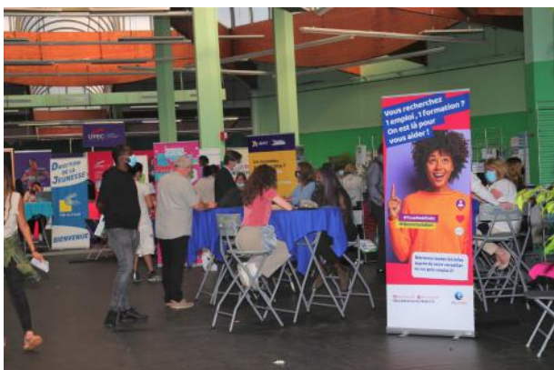
Forum « boost ton avenir » à Créteil le 22 septembre 2021

Parmi celles-ci, l'entreprise d'insertion ID'EES INTERIM F basée à Champigny-sur-Marne et conventionnée depuis le 1 er décembre 2021 propose à des salariés en insertion des missions d'intérim variées (aide-peintre, aide-plombier, agent d'accueil, canalisateur).