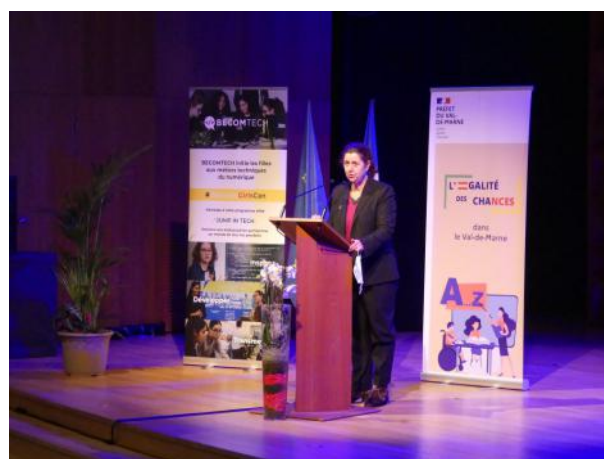
Clôture des journées départementales de l'égalité des chances par Mme la Préfète du Val-de-Marne, Sophie THIBAUT.

Un plan d'action départemental sur l'égalité des chances sera établi en 2022 à partir des conclusions de ces échanges.