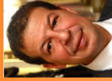
Bachir BAKHTI Sous-Préfet de l'arrondissement de Nogent- sur-Marne