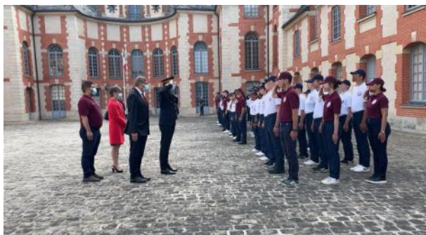
Les jeunes val-de-marnais participant au SNU 2021 (juin 2021) au château de Grosbois à Boissy-Saint-Léger.