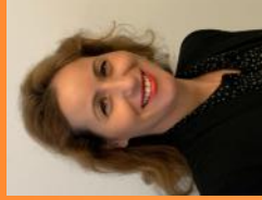
Faouzia FEKIRI Sous-Préfète chargée du développement économique et du suivi du plan de relance