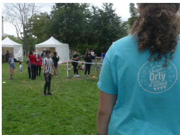
L'événement « Orly sous le soleil », du 13 juillet au 24 août 2021, financé par l'opération « Quartiers d'été ».

Reconduite en 2021, l'opération « quartiers d'été » finance des projets avec une priorité accordée aux activités inter-quartiers, intergénérationnelles et en faveur, des jeunes filles, des femmes, des jeunes de 12 à 25 ans et des familles. 162 actions ont été subventionnées à ce titre, pour un montant de 709 481 €.